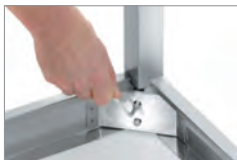
AJUSTABLE CON LLAVE HEXAGONAL PARA UN MONTAJE RÁPIDO