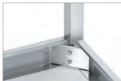
UNIÓN SÓLIDA DE LAS PATAS UTILIZANDO DOS TORNILLOS