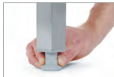
AJUSTES DE NIVELADO Y ALTURA ESTABLES